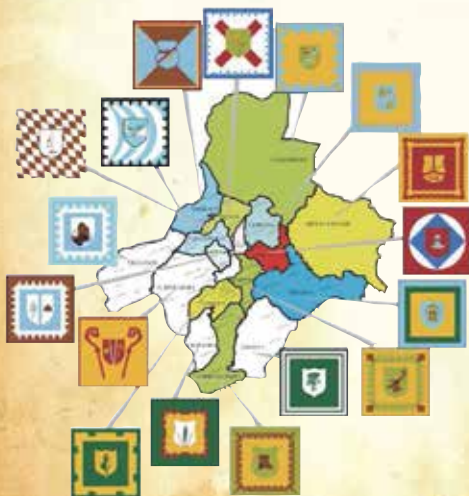
Le bandiere delle Contrade